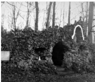
De Rotse Emmaüs op het Sint-Maartenspad in de Rolleweg